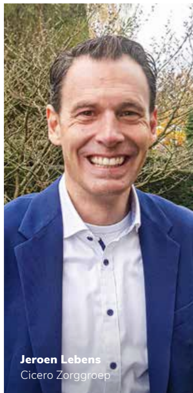
Jeroen Lebens Cicero Zorggroep